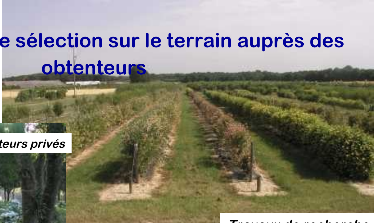
Travaux de recherche chez des obtenteurs privés